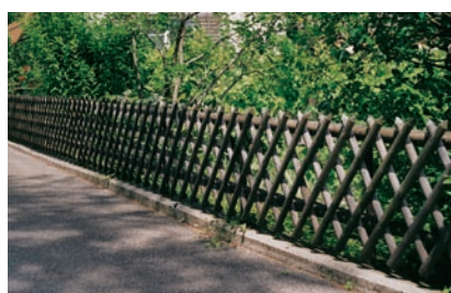
Kreuzzaun mit Holztraversen