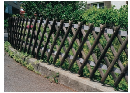
Kreuzzaun/Bogen mit Metalltraversen

Den Kreuzzaun liefern wir in Tannenholz. Die Traversen sind normalerweise aus Tannenholz halbrund, zylindrisch gefräst; diejenigen aus