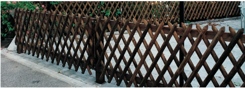
Kreuzzaun mit Vierkanttraversen