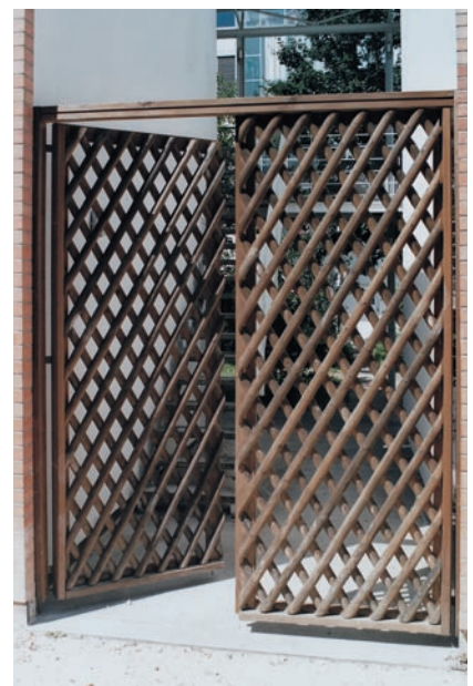
Kreuzzaun Eingangstor, Höhe 2,7 m